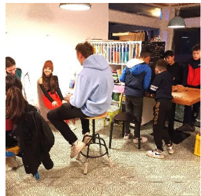
OT im Winter