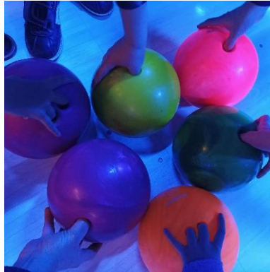
Bowling in den Semesterferien