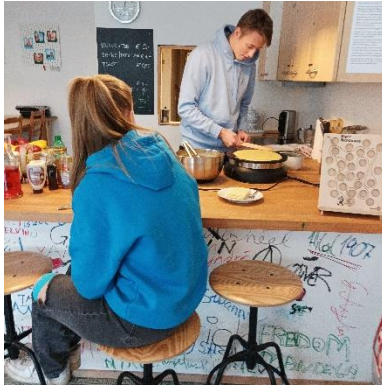
Entspannt bei „mig's“

Zwei Role-Models, eine Geschichte. Irritierend. Erfreulich. Nachzulesen in einer Bibel. Lukas-Evangelium. Kapitel 19. Verse 1-10