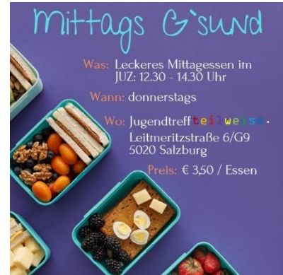
mig's – mittags g'sund