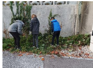
Das Hochbeet ist zusammgebaut und aufgestellt