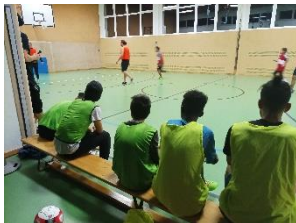
Sport im Park - jetzt in der Halle – zusammen mit der SPORT UNION

Eher schon, dass die Kids kamen und fragten, wann endlich wieder gespielt, gebastelt, gekocht werden kann. Kaum fing der „normale“ Betrieb an, stand ihre Frage im Raum, warum wir die ganzen Ferien geschlossen haben?! Und so ist jetzt neben einem MINT-Projekttag (MINT = M athe- I nformatik- N aturwissenschaften- T echnik) am 30.12. auch in der letzten Ferienwoche offen. Und das motiviert uns alle.