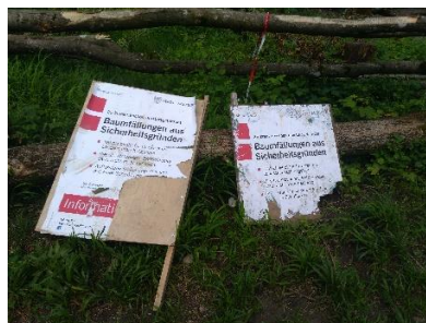
... finden nicht alle gut!