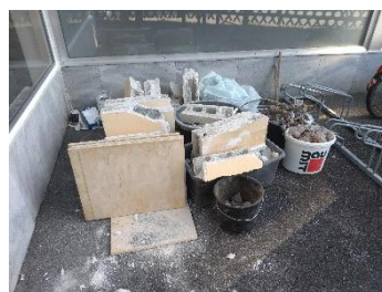
... macht Bauschutt, made in Salzburg 😊.