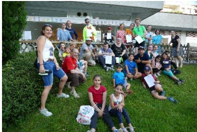
In Salzburg 1 ...

und Sponsoren an einem Tag € 5.618,- (!!! Stand 04.07.2020) für teilweise, für unseren Traum eines offenen Kinder- und Jugendtreffs, für unsere zukünftigen Projekte zu bekommen. Das begeistert und macht dankbar. Dankbar für die Menschen in der Nähe, Anwohner, die Besucher und Betreiber des Stüberls von nebenan, die LäuferInnen in Salzburg, am Attersee, Mattsee, in Bozen, Linz, Graz, Meran, Gänserndorf und unsere finanziellen Unterstützer und für die positiven, bekräftigenden Worte und die Freude. Diese Gefühle machen Lust auf eine Fortsetzung 2021... (AB)