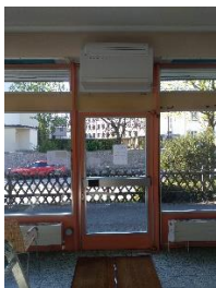
Eingang vorher: innen, außen