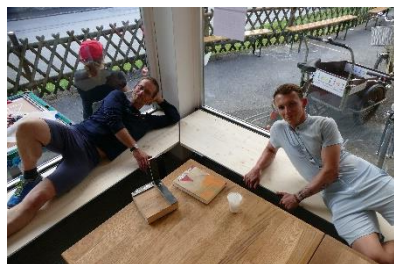
... und Ausbau ...