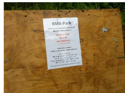
Gesprächsangebot I, es folgt jetzt II.